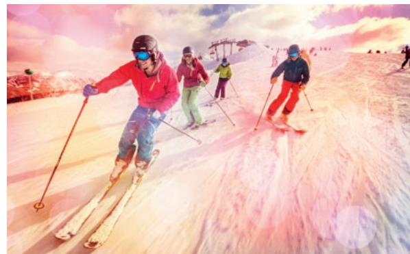
Bildbeispiele für Sujetbilder

ACHTUNG: BEI DER VERWENDUNG DER BILDER IMMER „© FLACHAU TOURISMUS“ IM IMPRESSUM BZW. BEI DRUCKSORTEN ANFÜHREN.